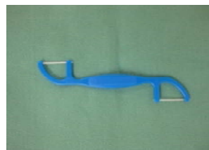
デンタルフロス(柄付きのもの)